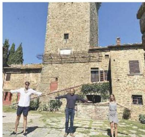
I giardini di Montecchio (sopra) e Gargonza sono tra le mete della manifestazione

Ritaglio Stampa ad uso esclusivo del destinatario. Non riproducibile